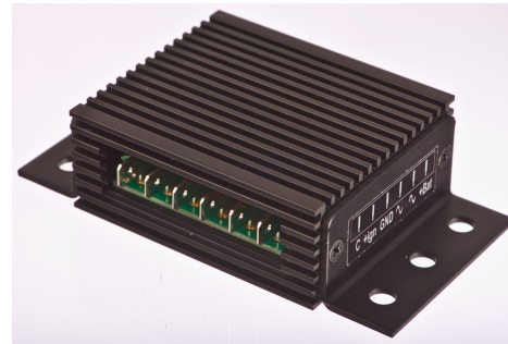
Abbildung 1 Anschlüsse des Reglers

Die Ladekontrollleuchte ist bei diesem Regler optional. Wenn das Motorrad keine Ladekontrollleuchte hat, lassen Sie einfach den C-Anschluss frei.